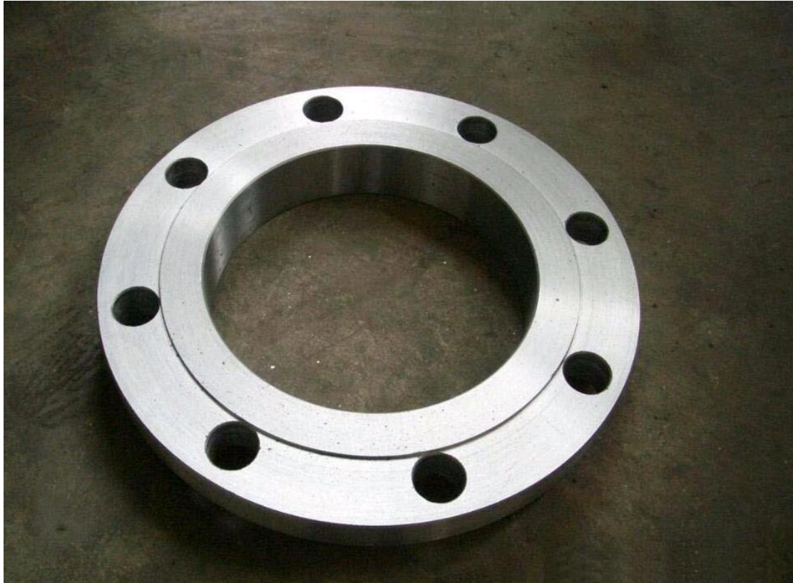
上图为 GB/T 9119 PN4.0 PL 平板法兰或近似法兰