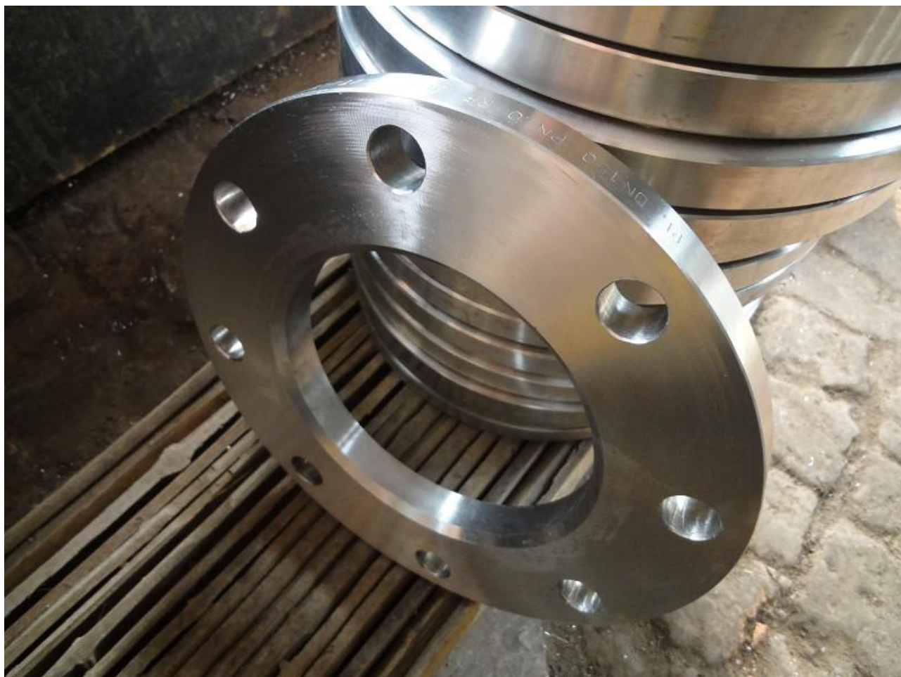
上图为 GB/T 9119 PN0.25 PL 平板法兰或近似法兰